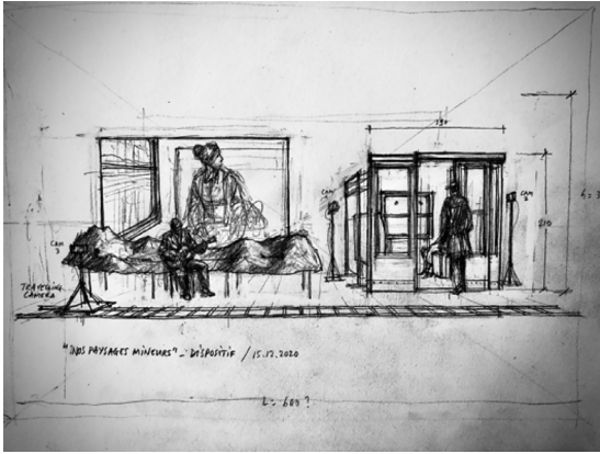
Dessin © Stephan Zimmerli