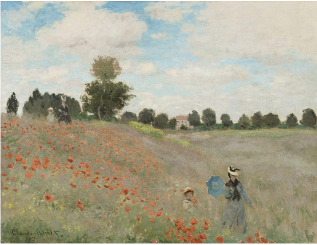
Les Coquelicots, Claude Monet

L'accent se portera sur la présence des acteur.ices, le texte et ses différents registres. Il s'agira d'abord de porter cette histoire d'une beauté sombre, d'en déployer toute la force émotionnelle et les interrogations qu'elle éveille. Il s'agit de maintenir une grande proximité, presque intime, avec le public, afin que chacun.e puisse faire une expérience sensible et physique de la représentation.