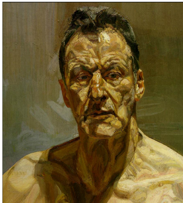
Reflection (autoportrait) (1985) Lucian Freud

Cela implique une forme d'incarnation particulière.