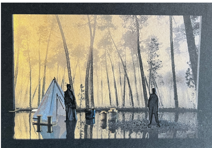
Partie 2: Milans noirs