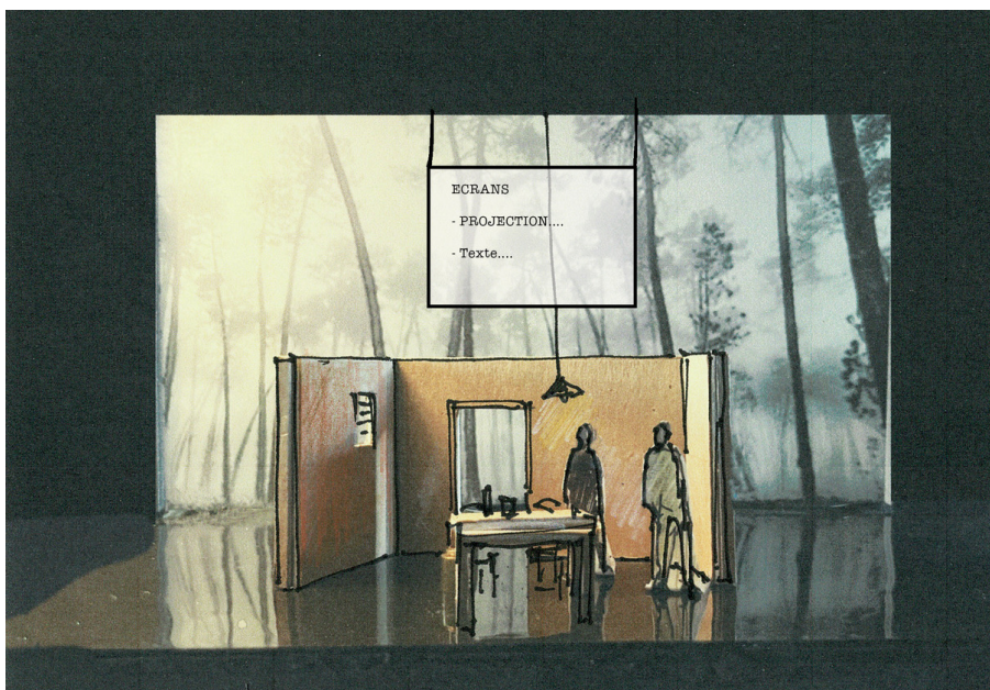
Partie 3: Gloria