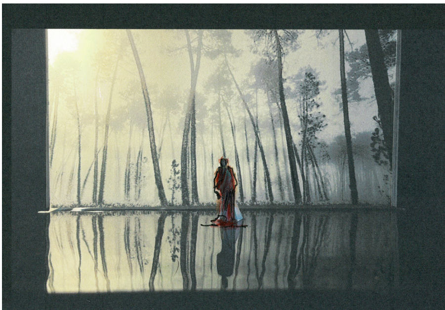
Partie 1: La bête apparut elle était déjà vacillante © Cécile Léna