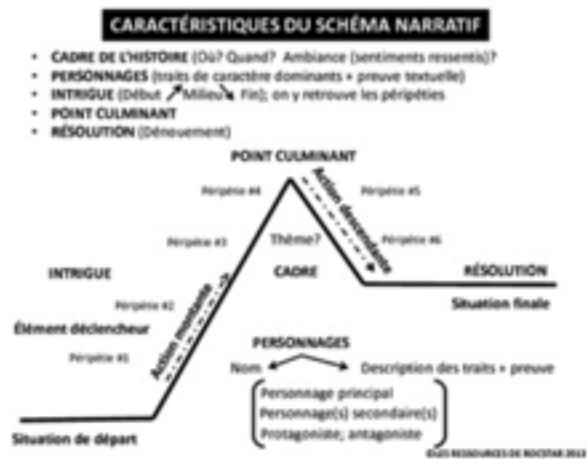
Un triangle narratif - schéma déjà plus touffu.